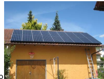
Kleines Dach, 4,32 kWp