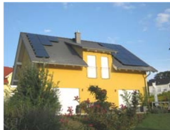
Ost- und Westdach 11,55 kWp