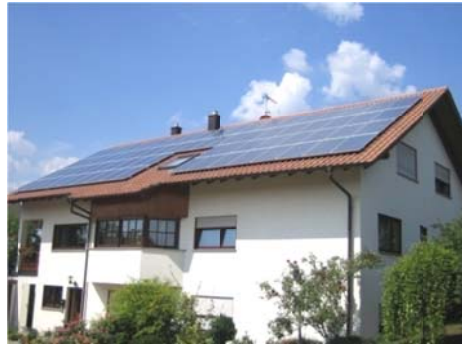
Großes Dach 14,20 kWp